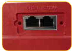
• Terminal Kommunikation Schnittstelle